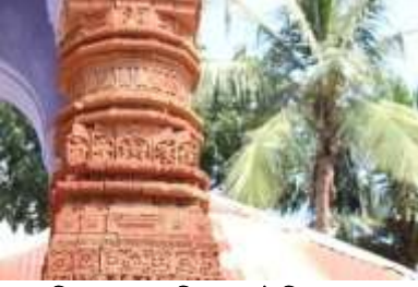
চিত্র নং-৩৪ পিলারে উদ্ভিদ ও প্রাণীতজগৎ কেন্দ্রিক নকশা