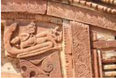
চিত্র নং- ২৫: বিষ্ণুর অনন্ত শয়ান