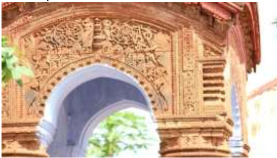
চিত্র নং: কৃষ্ণলীলার দৃশ্য ফলক

বাংলার মন্দির স্থাপত্যে পৌরাণিক কাহিনির মধ্যে কৃষ্ণ উপাখ্যানও কম জনপ্রিয়তা লাভ করেনি। কৃষ্ণের বাল্য থেকে যৌবনের নানা কাহিনির চিত্র তৎকালীন মন্দির নির্মাণকারী শিল্পীরা মন্দির গাত্রে প্রতিস্থাপিত করেছিল। গণপুরের মন্দিরেও আমরা কৃষ্ণ উপাখ্যানের নানা কাহিনি চিত্রকে মন্দির গাত্রে প্রতিস্থাপিত হতে দেখি। কালীতলার ২ নং মন্দিরটির একেবারে সামনের অংশে রয়েছে—গোপীনিসহ শ্রীকৃষ্ণের লীলার দৃশ্য ফলক। ৩ নং মন্দিরের একেবারে ওপরের অংশে রয়েছে—রাধা কৃষ্ণের যুগল মূর্তি ও কৃষ্ণের ষড়ভূজ মূর্তি। ৫ নং ও ৬ নং মন্দিরের সামনের অংশেও রয়েছে রাধা ও সখি সহ কৃষ্ণের নানান লীলা দৃশ্য। ৮ ও ১০ নং মন্দিরের একেবারে ওপরের অংশে অন্যান্য পৌরাণিক দেবদেবীদের সঙ্গে কৃষ্ণেরও ফলক দেখা যায়। দোলমঞ্চের টেরাকোটার ফলকে আমরা দেখতে পাই—রাসচক্র, রাধা কৃষ্ণ, নৌকা বিলাস, গোপীনিদের সাথে শ্রীকৃষ্ণ, কৃষ্ণের ষড়ভূজ মূর্তি ইত্যাদি (চিত্র নং- ১৭, ৩ ১৮)।