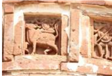
চিত্র নং-২৩: ষাঁড়ের পিঠে শিব