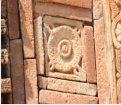
চিত্র নং: ত্রিকোণা ফলক

বিভিন্ন আকার ও আকৃতির ফলক তৎকালীন শিল্পী কারিগরেরা মন্দিরগাত্রে প্রতিস্থাপিত করেছে। নানান হিসাব নিকাশ করে বিভিন্ন আকারের ফলক মন্দিরগাত্রে প্রতিস্থাপন করা হয়েছে। বিভিন্ন ঘটনা ও কাহিনিকে মন্দিরগাত্রে প্রতিস্থাপন করার জন্য ফুলপাথরকে ছোট, বড়ো, লম্বাটে, ত্রিকোণা প্রভৃতি নানান ধরনের মাপ করে কেটে নেওয়া হয়েছে। আবার মন্দিরের একেবারে সম্মুখ অংশে রাম-রাবণের যুদ্ধ দৃশ্য দেখানোর জন্য একটি বড়ো আকারের পাথরকেই খোদাই করে যুদ্ধের বর্ণনা তুলে ধরা হয়েছে। আর ছোট ছোট আকারের ফলকগুলি কোথাও মন্দিরগাত্রে সজে লেগে রয়েছে বা সেঁটে রয়েছে আবার কোথাও মন্দিরগাত্র থেকে কিছুটা ওপরের দিক করে প্রতিস্থাপিত করা হয়েছে। পৌরাণিক ঘটনা বা ঐতিহাসিক ঘটনা বা সমাজচিত্র প্রতিস্থাপনের ক্ষেত্রে মন্দিরের একেবারে ওপরের অংশে বা দুই পার্শ্ব বা মন্দিরে নিচের অংশে ত্রিকোণা আকারের ছোট ছোট ফলকগুলি সারিবদ্ধভাবে ওপরের ও নিচের অংশে লম্বালম্বিভাবে দুই পার্শ্বের অংশে ব্যবহার করা হয়েছে। মন্দিরের দুই কর্ণারে ত্রিকোণা আকারের ফলক ব্যবহার করে হাতি ও ঘোড়ার মোটিফ প্রতিস্থাপন করা হয়েছে (চিত্র নং-১১, ১২ ও ১৩)।