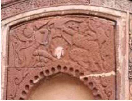
চিত্র নং- ১৪: রাম রাবণের সম্মুখ সমর