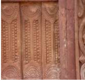
চিত্র নং-১২: লম্বা ফলক