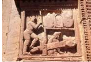
চিত্র নং- ২৯: টেকিতে পাহাড় দেওয়ার দৃশ্য