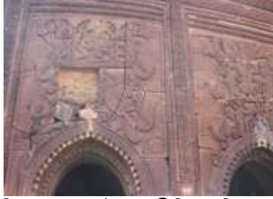
চিত্র নং-৭: আটচালা রীতির মন্দিরের সন্মুখ অংশ