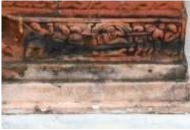
চিত্র নং- ২৮: পালকি বহনের দৃশ্য