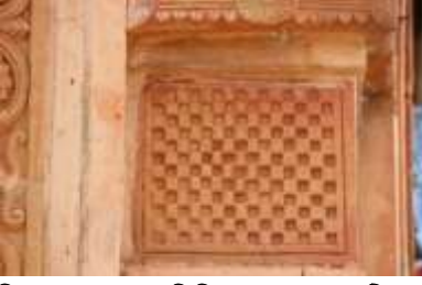
চিত্র নং-৩৭: জ্যামিতিক নকশার মোটিফ