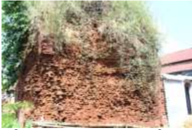
চিত্র নং- ৪০: প্রায় ধ্বংশপ্রায় মন্দির