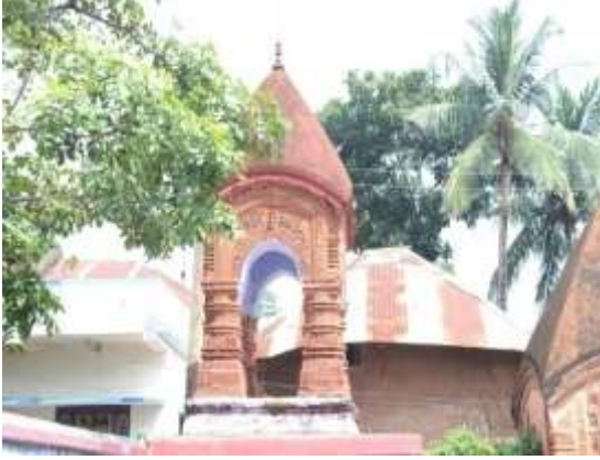
চিত্র নং- ৯: দোলমঞ্চ

গণপুর গ্রামে নির্মিত দোলমঞ্চটিতে আমরা টেরাকোটা বা পঞ্জ উভয়েরই অলংকরণ দেখতে পায়। ফুলপাথরের কোন অলংকরণ এই দোলমঞ্চটিতে দেখা যায় না। প্রায় ৭-৮ ফুট উচ্চ একটি ভিত্তি ভূমির ওপর এই দোলমঞ্চটি অবস্থিত। চতুর্দিক খোলা চারটি পিলার বা থাম বিশিষ্ট এই দোলমঞ্চের ওপরের অংশটি চারচালা রীতিতে নির্মিত। রাসপূর্ণিমা বা দোলপূর্ণিমা উপলক্ষে পূর্বে এই দোলমঞ্চটিতে রাধাকৃষ্ণের দোল যাত্রা বা রাস উৎসব অনুষ্ঠিত হত (চিত্র নং- ৯ ও ১০)।