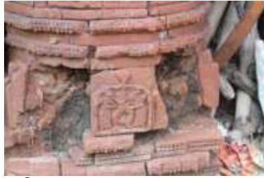
চিত্র নং- ৪১: ভগ্ন প্রায় ফুলপাথরের ফলক