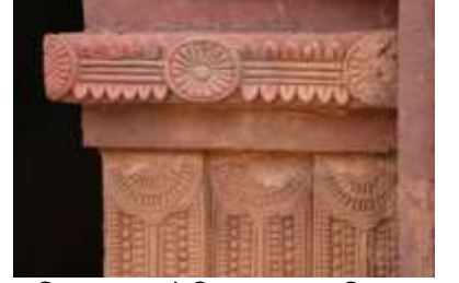
চিত্র নং-৩৯: উদ্ভিদ জগৎতকেন্দ্রিক মোটিফ

৮. সংরক্ষণ বা রক্ষণাবেক্ষণ: গণপুর গ্রামে এখনও পর্যন্ত ২৩ টি মন্দির রয়েছে। সরকারীভাবে ভারতীয় পুরাতাত্ত্বিক সংরক্ষণ বিভাগ এই প্রাচীন মন্দিরগুলিকে নিজেদের আওতায় এখনও পর্যন্ত নেয়নি। এই গ্রামে আটচালা রীতির যে ১৮ টি শিব মন্দির ছিল সেই শিব মন্দিরগুলি যথার্থ সংরক্ষণের অভাবে আজ ধুলিসাৎ হয়ে গেছে। সেগুলির চিহ্নমাত্র আজ আর পাওয়া যায় না। বর্তমানে মন্দিরগুলি খুবই অবহেলিত অবস্থায় অনাদরে পড়ে রয়েছে। রাজ্য বা কেন্দ্র সরকারের পক্ষ থেকে এই মন্দিরগুলি সংরক্ষণের কোন ব্যবস্থা তো নেওয়া হয়নি এমনকি স্থানীয় প্রশাসনও এ ব্যাপারে কোন উদ্যোগ গ্রহণ করেনি। এই গ্রামের মন্দিরগুলি সংরক্ষণের জন্য গ্রামে কোন কমিটি বা সংগঠন আজ অন্দি গড়ে হয়নি (চিত্র নং- ৪০, ৪১ ও ৪২)।