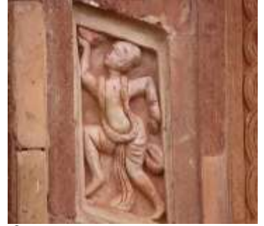
চিত্র নং- ১৬; ফুলপাথরের ফলকে হনুমান

রামায়ণের রাম-রাবণের কাহিনির মতো মহাভারতের নানান কাহিনি চিত্রও বাংলার মন্দিরের অলংকরণে শোভা বর্ধন করেছিল। কালীতলা মন্দির প্রাঙ্গণে যে ১৭ টি ফুলপাথরের মন্দির রয়েছে তাতে কোন মহাভারতের দৃশ্য চিত্র আমরা দেখতে পাই না। এমনকি পরিত্যক্ত বিষ্ণু মন্দিরেও মহাভারতের কাহিনি সম্পর্কিত কোন দৃশ্যফলক নেই। গণপুর গ্রামে শুধু কালীতলা মন্দির প্রাঙ্গণে যে পাঁচটি ফুলপাথরের অলংকরণযুক্ত মন্দির রয়েছে সেখানে আমরা মহাভারতের কাহিনি চিত্রের দৃশ্য ফলক দেখতে পাই। এই প্রাঙ্গণের ডানদিক থেকে ৩ নং মন্দিরে দুটো মাত্র মহাভারতের দৃশ্য ফলক বর্তমানে রয়েছে। এই ফলক দুটি হল— শকুনির ও যুধিষ্ঠিরের পাশা খেলার দৃশ্য এবং দ্রৌপদীর বস্ত্র হরণের দৃশ্য।