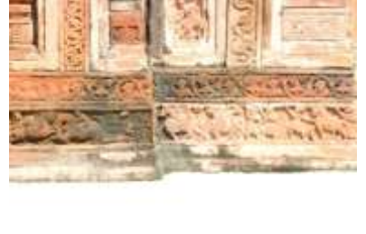
চিত্র নং-৩৩: যুদ্ধ যাত্রার দৃশ্য

মোটফ বা নকশা: গণপুর গ্রামে ফুলপাথর দ্বারা অলংকৃত মন্দিরগুলিতে ছোট বড়ো বিভিন্ন আকারের ফলকে বা ফলকের চারপাশের নকশায় আমরা বিভিন্ন ধরনের মোটিফ বা নকশা দেখতে পাই। ফুল লতা পাতার নকশা, রূপচিহ্ন, প্রাণীজগতের বিভিন্ন পশুপক্ষী, জ্যামিতিক বিভিন্ন নকশা প্রভৃতি মন্দির দেহের একটা বড়ো অংশ জুড়ে স্থান করে নিয়েছে। মন্দিরের দুই পার্শ্ব খিলান এবং মন্দিরের নিচের অংশে কোন পৌরাণিক বা সামাজিক বা ঐতিহাসিক ঘটনার পাশে বা ফলকের চারধারে দক্ষ শিল্পীদের নিপুণ হাতের ছোঁয়ায় এই সমস্ত মোটিফ বা নকশাগুলি মন্দিরগাত্রে অলংকৃত হয়েছে।