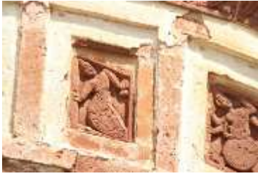
চিত্র নং- ২২: মৎস্য ও কূর্ম অবতার