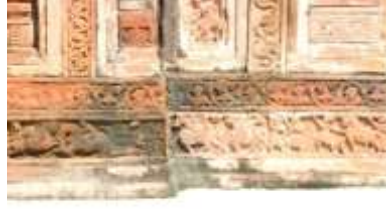
চিত্র নং-৩৫: প্রাণীজগৎ কেন্দ্রিক নকশা