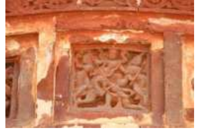
চিত্র নং- ২৭: দুর্গার অসুর নিধন

সমাজচিত্র: মন্দির নির্মাণকারী শিল্পী কারিগরেরা পশ্চিমবঙ্গের যে সব অঞ্চলে মন্দির নির্মাণ করতে গিয়েছে সেই অঞ্চলের দৈনন্দিন জীবনের প্রতিচ্ছবি মন্দিরগাত্রে প্রতিফলিত করেছে। সমাজীবনের বিবিধ দিক তৎকালীন মন্দিরগাত্রে ফলক প্রতিস্থাপনের পাশাপাশি আমাদের সমাজজীবনে ঘটে যাওয়া কাহিনি চিত্র সম্বলিত ফলকের প্রতিস্থাপন মন্দিরের নান্দনিক গুরুত্বকে বাড়িয়ে দেওয়ার জন্য কিন্তু কম কার্যকারী ভূমিকা পালন করেনি। বীরভূমের এই গণপুর গ্রামের ফুলপাথরের অলংকরণে মন্দিরগাত্রে প্রতিস্থাপিত ফলকে আমরা তৎকালীন গ্রাম্যজীবনের বিবিধ চিত্রকে ফুটে উঠতে দেখি। সমাজজীবন বিষয়ক চিত্র ফলকগুলি আমরা মন্দিরের নিচের অংশ এবং দুই পার্শ্বে সাধারণত প্রতিস্থাপন হতে দেখি।