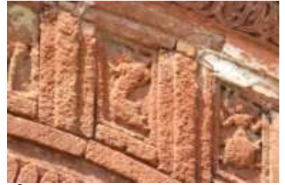
চিত্র নং- ৪২: ক্ষয়ে যাওয়া ফুলপাথরের ফলক

উপসংহার: ফুলপাথরের অলংকরণযুক্ত ‘মন্দিরের গ্রাম’ গণপুরের মন্দিরগুলির পুরাতত্ত্ব, লোকসংস্কৃতি ও ইতিহাসের প্রেক্ষিতে গুরুত্ব ও মূল্য সত্যিই অপরিসীম। এই গ্রামের মন্দিরগুলির গঠনরীতি, অলংকরণশৈলী ও অলংকরণের বিষয় গণপুরের মন্দির স্থাপত্যকে সত্যিই আলাদা মাত্রা প্রদান করেছে। আর্থ-সামাজিক-সাংস্কৃতিক মূল্য থাকা সত্ত্বেও বর্তমানে এই গ্রামের মন্দিরগুলি সত্যিই বড়ো অনাদর ও অবহেলার রয়েছে। এই গ্রামের মন্দিরগুলি সঠিকভাবে সংরক্ষণ ও রক্ষণাবেক্ষণের জন্য কোন কালে কোন উদ্যোগই নেওয়া হয়নি। বিজ্ঞানসম্মত ও সঠিক পদ্ধতি প্রয়োগ করে গণপুরের ফুলপাথরের মন্দিরগুলিকে সংরক্ষণ করতে হবে। তবেই এই মহান কীর্তিগুলি সুরক্ষিত থাকবে। পরিশেষে এ-কথাই বলা যায় যে গণপুর গ্রামে অবস্থিত ফুলপাথরের মন্দিরগুলি অত্যন্ত গুরুত্বপূর্ণ ও তাৎপর্যময়।