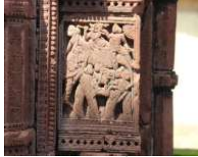
চিত্র নং-২০: নবনারীটকুঞ্জ