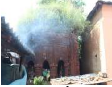
চিত্র নং-৬: আটচালা রীতির মন্দির