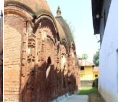
চিত্র নং-১: কালীতলা প্রাঙ্গণের চিত্র নং-২: ফুলপাথরের মন্দির ফুলপাথরের মন্দির