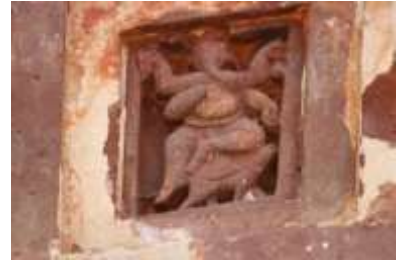
চিত্র নং- ২৪: গণেশ