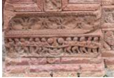
চিত্র নং- ২৬: সমুদ্র মন্থন