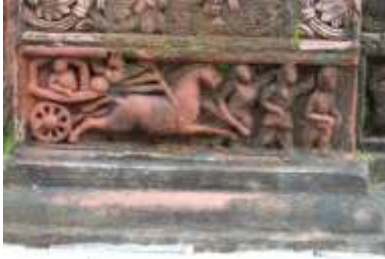
চিত্র নং-৩২: রথে করে যুদ্ধ করতে যাওয়ার দৃশ্য