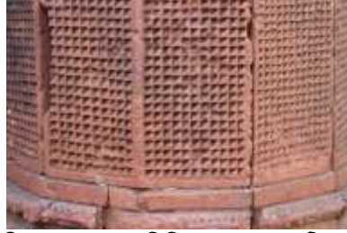
চিত্র নং-৩৮: জ্যামিতিক নকশার মোটিফ