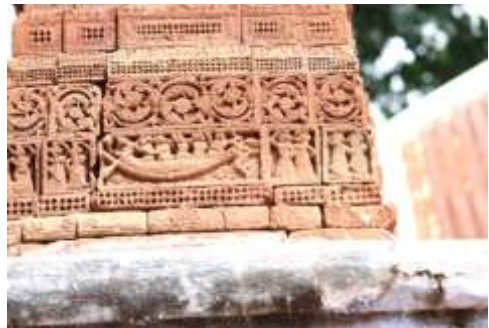
চিত্র নং- ১৮: নৌকাবিলাস