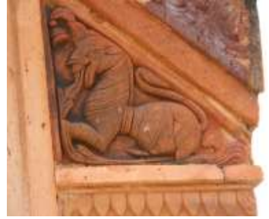
চিত্র নং-১৩: ত্রিকোণা ফলক

সলকালীন শিল্পী কারিগরেরা অনেক হিসাব নিকাশ করে নির্দিষ্ট পদ্ধতি অনুযায়ী বিভিন্ন মাপের ফলক মন্দিরে প্রতিস্থাপিত ঘটনাবলীর সঙ্গে সামঞ্জস্য ও তাৎপর্য রেখে তৈরি করেছে। এখানকার মন্দিরগাত্রে প্রতিস্থাপিত ফলকগুলির মাপ হল— 18 \times 20 ইঞ্চি, 15 \times 15 ইঞ্চি, 18 \times 12 ইঞ্চি, 12 \times 10 ইঞ্চি, 10 \times 8 ইঞ্চি, 8 \times 8 ইঞ্চি, 8 \times 6 ইঞ্চি, 9 \times 9 ইঞ্চি, 6 \times 5 ইঞ্চি, 5 \times 3 \times 2 ইঞ্চি, 8 \times 8 ইঞ্চি, 8 \times 3 ইঞ্চি, 3 \times 8 ইঞ্চি, 2 \times 2 ইঞ্চি ইত্যাদি।