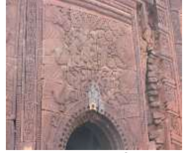
চিত্র নং-২১: কৃষ্ণলীলা