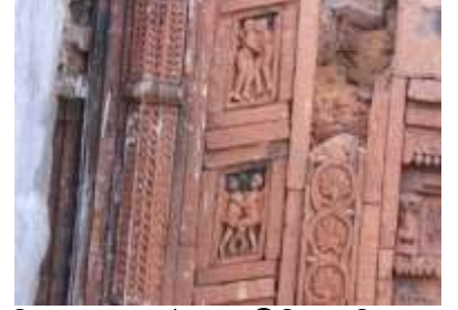
চিত্র নং-৮: আটচালা রীতির মন্দিরের পার্শ্বের অংশ