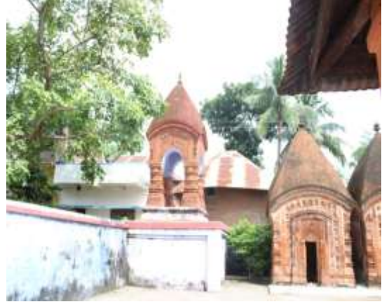
চিত্র নং- ১০: দোলমঞ্চ

বৈশিষ্ট্য: দোলমঞ্চের বৈশিষ্ট্যগুলি হল নিম্নরূপ: