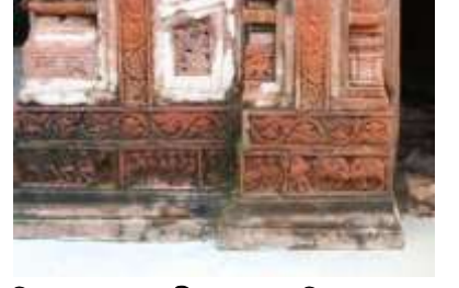
চিত্র নং-৩৬: প্রাণীতজগৎ কেন্দ্রিক নকশা