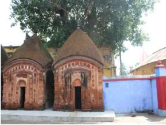
চিত্র নং: ৪ চালা রীতির মন্দির