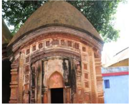
চিত্র নং: ৫ চালা রীতির মন্দির

বৈশিষ্ট্য: গণপুরের চারচালা রীতির মন্দিরের বৈশিষ্ট্যগুলো হল: