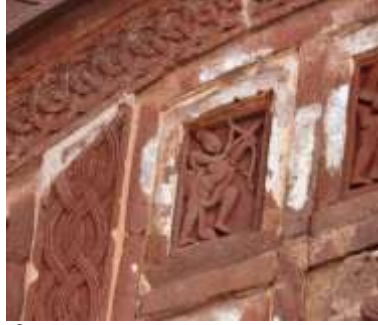
চিত্র নং-১৫: ফুলপাথরের ফলকে রাম