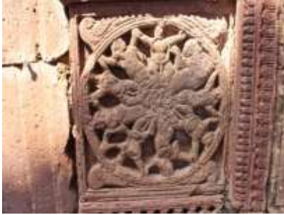
চিত্র নং-১৯: রাসচক্র

কালীতলার উল্টো দিকের ২ নং মন্দিরের ওপরের অংশে কৃষ্ণলীলার নানান দৃশ্য ও নবনারীকুঞ্জের ফলক রয়েছে। ৩ নং মন্দিরের দুই পার্শ্বেও রয়েছে কৃষ্ণলীলার নানান দৃশ্য ফলক। ৫ নং মন্দিরের সামনের অংশেও রয়েছে কৃষ্ণলীলার নানা দৃশ্য চিত্র ও মূর্তি। বিষ্ণু মন্দিরের দুই পার্শ্বেও রয়েছে কৃষ্ণলীলার নানান ফলক (চিত্র নং- ১৯, ২০ ও ২১)।