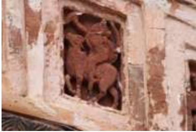
চিত্র নং-৩১: ঘোড়ার পিঠে চড়ে সৈন্য

ঐতিহাসিক ঘটনা: গণপুরের মন্দিরগুলিতে ঐতিহাসিক ঘটনার ফলকগুলি সাধারণত মন্দিরের নিচের দিকের অংশে লম্বা লাইন করে সারিবদ্ধভাবে বিন্যস্ত রয়েছে। এখানকার মন্দিরগুলিতে ঐতিহাসিক ঘটনায়ুক্ত ফলকগুলির মধ্যে স্থান করে নিয়েছে—বন্দুক হাতে সৈন্য, ঘোড়ার পিঠে চড়ে সৈন্য, রাজার সৈন্য সামন্ত নিয়ে যুদ্ধ করতে যাওয়ার দৃশ্য, তরোয়াল হাতে সৈন্য, ঢাল তলোয়াল হাতে দুইজন সৈন্যের সন্মুখ সমর ইত্যাদি (চিত্র নং- ৩১, ৩২ ও ৩৩)।