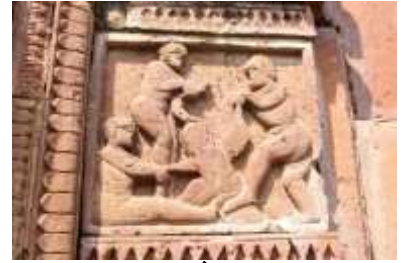
চিত্র নং- ৩০: কাঠ চেরায়ের দৃশ্য

ঐতিহাসিক ঘটনা: গণপুরের মন্দিরগুলিতে ঐতিহাসিক ঘটনার ফলকগুলি সাধারণত মন্দিরের নিচের দিকের অংশে লম্বা লাইন করে সারিবদ্ধভাবে বিন্যস্ত রয়েছে। এখানকার মন্দিরগুলিতে ঐতিহাসিক ঘটনায়ুক্ত ফলকগুলির মধ্যে স্থান করে নিয়েছে—বন্দুক হাতে সৈন্য, ঘোড়ার পিঠে চড়ে সৈন্য, রাজার সৈন্য সামন্ত নিয়ে যুদ্ধ করতে যাওয়ার দৃশ্য, তরোয়াল হাতে সৈন্য, ঢাল তলোয়াল হাতে দুইজন সৈন্যের সন্মুখ সমর ইত্যাদি (চিত্র নং- ৩১, ৩২ ও ৩৩)।