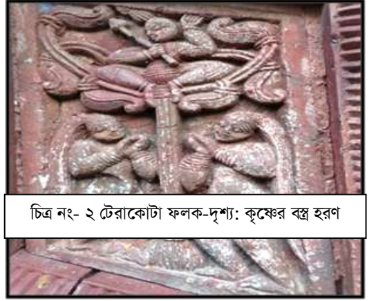
চিত্র নং- ২ টেরাকোটা ফলক-দৃশ্য: কৃষ্ণের বস্ত্র হরণ